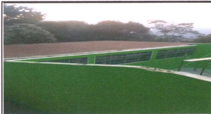
Foto 1: Sustitución de lámina, por lámina troquelada, 88 M2 . Sustitución de capote de lamina para lamina troquelada 4 ML