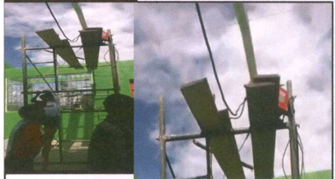
Foto 2: Sustitución de estructura de soporte de madera, por metal, 90ML