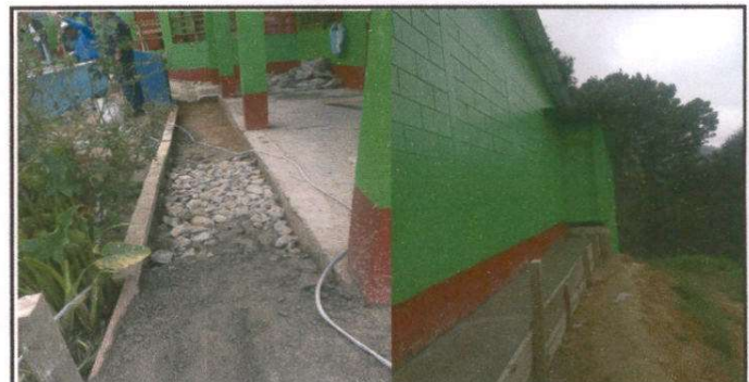
Foto 6 Reparación de banquetas de concreto y cunetas 16 M2

Observación: Si es necesario se pueden agregar hojas adicionales y actualizar el número de hojas.