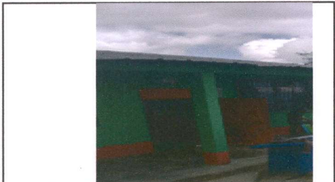
Foto 3 Mantenimiento a estructura (lijado, cambio de tubo , cepillado, sujeciones, aplicación de pintura) 4 unidades.